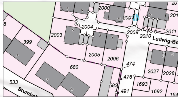
Ausschnitt aus der Liegenschaftskarte/ Flurkarte

Aus den in ALKIS geführten Daten, den Geobasisdaten, stellt das Amt für Liegenschaftskataster und Geoinformation unterschiedliche Karten und Auszüge (z.B. Flurkartenauszüge, Flurstücks- und Eigentumsnachweise) bereit.