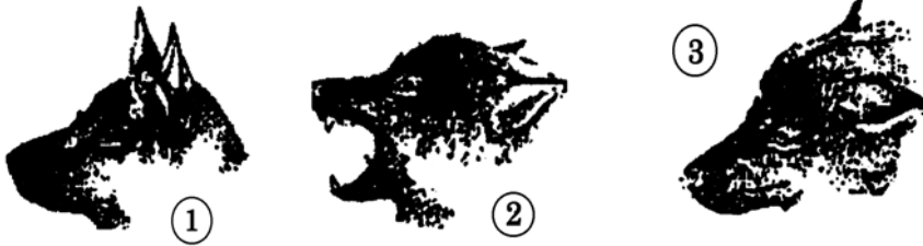
Abbildung..... Abbildung..... Abbildung.....

A4. Ordnen Sie nachstehende Begriffe den aufgeführten Geräuschen zu: