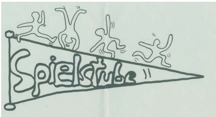
Abbildung 1: Logo Spielstube Hürth